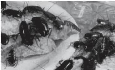
Bild 4: Orientalische Schaben bei der Nahrungsaufnahme

Die Schaben sind in ihrer Nahrungswahl wenig anspruchsvoll. Sie sind ausgesprochene Allesfresser, selbst vor ihren eigenen Artgenossen schrecken sie nicht zurück.