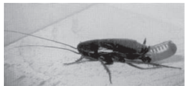
Bild 2: Orientalische Schabe mit Eipaket